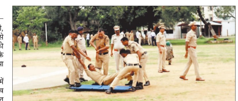
बलवा ड्रिल में शामिल पुलिस कर्मी।