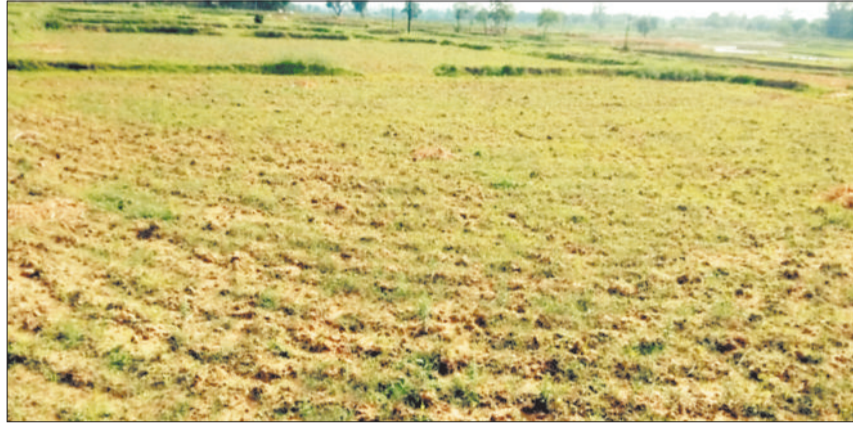
बारिश नहीं होने से सूख रहा खेत।

वहीं कुछ दिनों से लगातार सुबह धूप निकल रही है और दोपहर होते आसमान में बादल छा रहे हैं और धूप-छांव की स्थिति बन रही है। कई दिनों से बारिश नहीं होने के कारण उमस भरी गर्मी से लोगों को परेशान होना पड़ रहा है। उमस भरी गर्मी के कारण लोगों को पसीने से तर-बतर होना पड़ रहा है। आसमान में बादल तो रोज दिन छा रहे हैं, लेकिन उमड़ते-धूमड़ते बादल बिन बरसे ही छंट जा रहे हैं। इस तरह की स्थिति जिलेभर में है, कुछ दिनों से बारिश के थम जाने के कारण सबसे ज्यादा चिंता किसानों को रहा है।